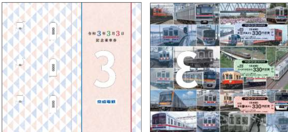
記念乗車券（左：外面、右：中面）